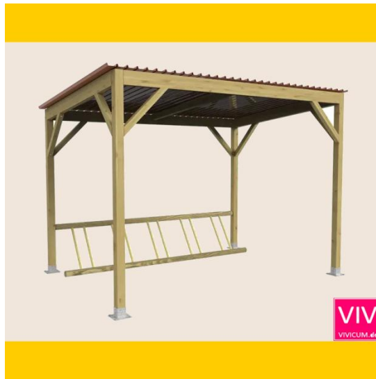
Grundmodul mit Fahrradständer