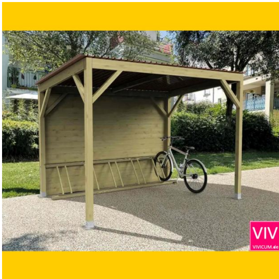
Grundmodul mit optionaler Rückwand